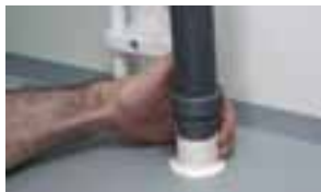
Pressa fast bandet