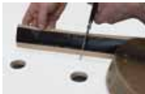
Klipp av lämplig längd