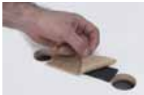
Pressa fast tätningbandet