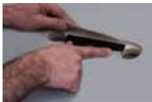
Tryck fast insatsen