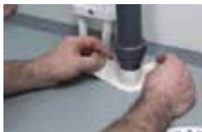
Fäst bandet runt