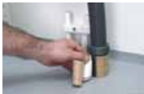
Mät omkrets + klipp